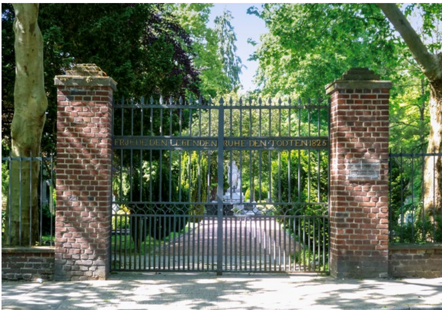
Eingangstor des Friedhofs in der Kölnstraße