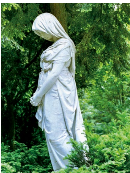
Grabskulpturen von J. Uphues

Die Dringlichkeit einer grundlegenden Restauration des Friedhofs in seiner Gesamtheit und fast aller unter Denkmalschutz stehender Grabmäler führte im Jahr 1999 schließlich zur Gründung des Fördervereins Evangelischer Friedhof Kölnstraße. Es konnten in erheblichem Umfang Mittel gesammelt werden und ein professioneller Restaurator wurde mit den Wiederherstellungen beauftragt. Den sich ändernden Bestattungsgewohnheiten wurde durch Schaffung eines Bereichs für die Beisetzung von Urnen Rechnung getragen. Die Restauration des Friedhofs und seiner Grabmäler war auch ein wesentlicher Anstoß zum Bau des Columbariums und der Emmauskapelle. Beisetzungen, auch anderer Konfessionen, finden heute wieder in größerer Zahl statt.