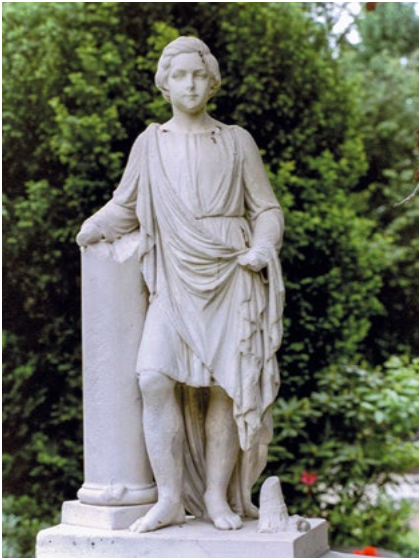
Grabmäler von Edmund Renard