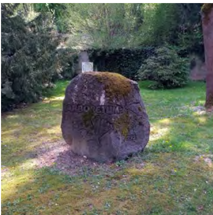
Arboretum, Platanenallee, Gebäude

Zweiten Weltkrieg ziehen den Blick auf sich, die Platanenallee erinnert an eine klassische Allee aus den Gründerjahren, die Ehrenmäler vom Napoleonstein bis zum Hochkreuz des Ostens reichen stilistisch vom Klassizismus bis zur Neugotik. Dass Koblenz' Hauptfriedhof historisch mit der Zeit mitwuchs und etliche Zeitgeister aufgesogen hat, führt hierbei nicht zu einem Durcheinander, sondern zu einem Miteinander. Die Szenarien wirken nicht überlagert, sie leiten eher von einem zum anderen weiter. Selbst die aus verschiedenen Jahrzehnten stammenden Kapellen, Hallen und