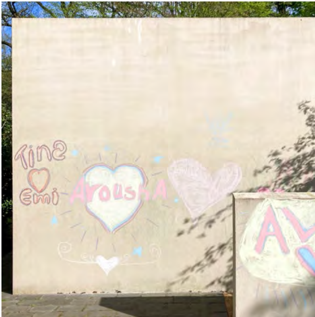
Vordere Außenwand der Trauerhaltestelle mit bunten Herzen und Namen.