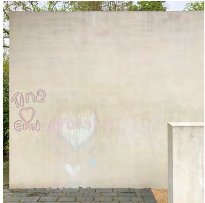
Dieselben Zeichnungen eine Woche später halb verwaschen.