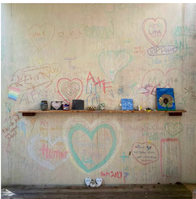
Innenwand der Trauerhaltestelle mit zahlreichen Nachrichten und einem Regal mit abgelegten Gegenständen.

So offen wie die gestalterischen Möglichkeiten gelassen sind, so verschieden sind die Botschaften, die Besucher*innen an der Trauerhaltestelle gestalten. Ausgefallene Beispiele dafür sind neben den Wänden die Nutzung der Decke als Leinwand, Tic-Tac-Toe-Felder und das aufwendig gemalte Bild der Hündin Ida. Wenn man bei einzelnen Beiträgen über die Angemessenheit zweifelt, so lässt sich doch in der Überzahl die sehr persönliche Auseinandersetzung mit dem Tod und der eigenen Trauer nachvollziehen. Häufig richten sich Botschaften direkt an die Verstorbenen und es stehen die jeweilige Beziehung zu ihnen im Vordergrund – nicht die neutrale Präsentation für die Allgemeinheit. →