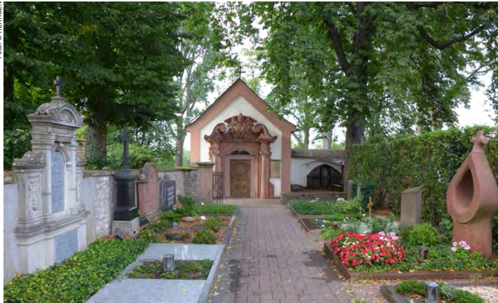
→ Kapelle „Noth Gottes“